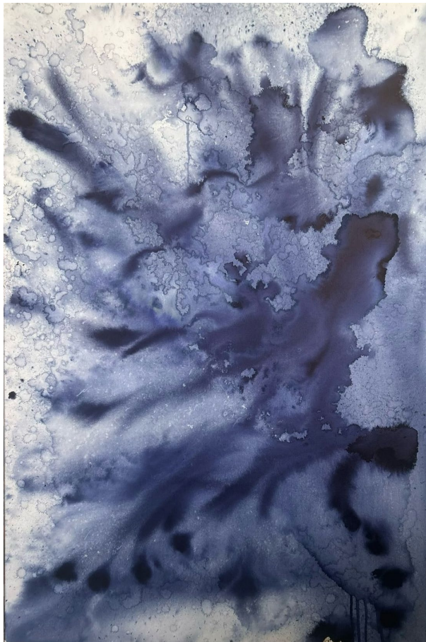
© Joëlle Cabanne, Genius Loci * Plaine Morte 2024, encre indigo et eau de glacier sur toile, 120 X 80 cm.