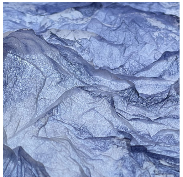
© Joëlle Cabanne, Genius Loci , photographie, 20 x 20 cm.