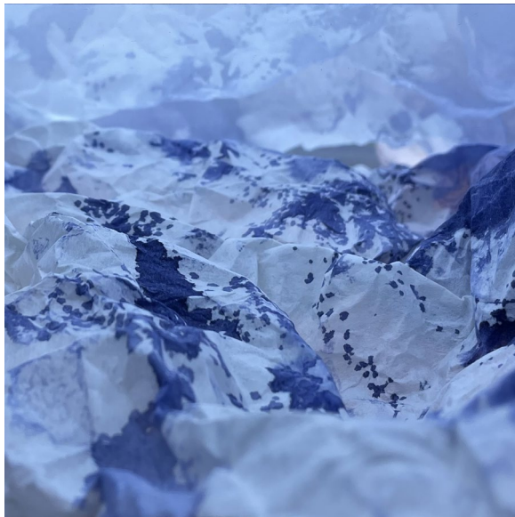
© Joëlle Cabanne, Genius Loci , photographie, 20 x 20 cm.

Cette symbolique de lumière et d'obscurité se retrouve dans de nombreuses philosophies orientales, où l'équilibre entre opposés est essentiel à la compréhension de l'univers.