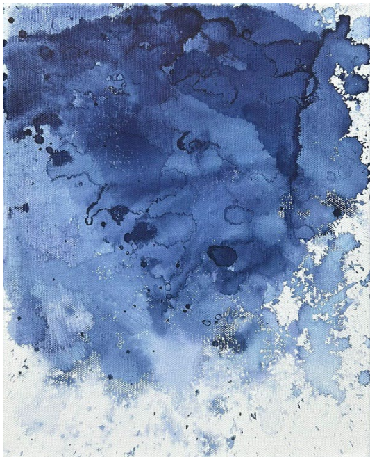
© Joëlle Cabanne Genius loci , 2025, Encre indigo sur toile, 24 x 30 cm.