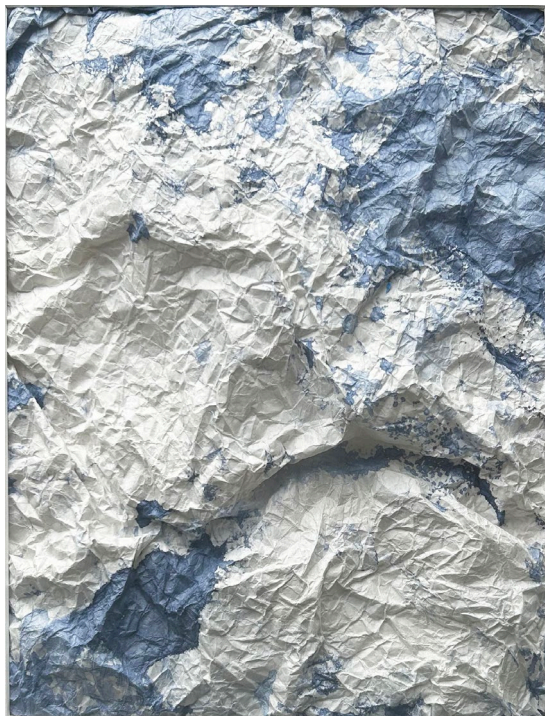
© Joëlle Cabanne, Genius Loci *1 volume , 2025, encre indigo sur papier Hawagami 70g, 54 x 42 cm.