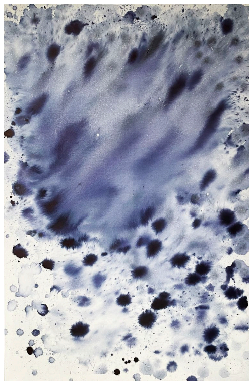
© Joëlle Cabanne, Zinal , 2024, encre indigo et eau de glacier sur toile, 120 X 80 cm.