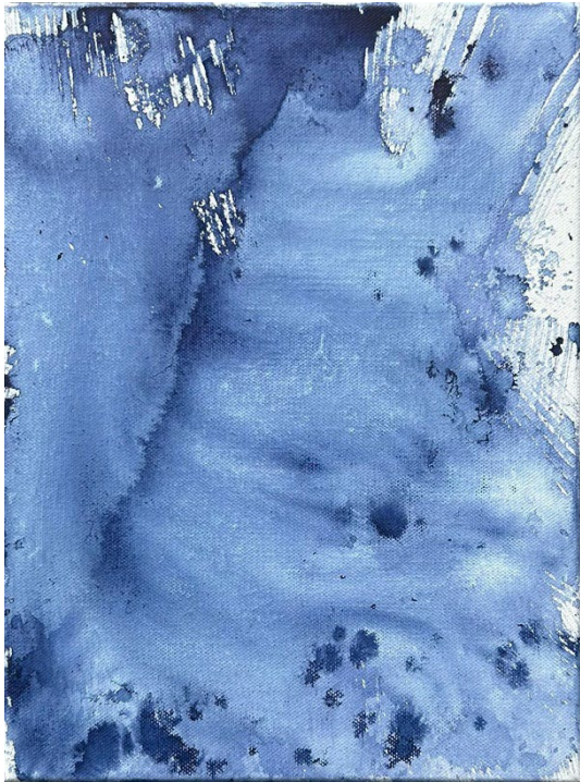
© Joëlle Cabanne, Genius loci , 2025, Encre indigo sur toile, 24 x 30 cm.

Dans le contexte spirituel japonais, l'indigo est souvent associé à la pureté, à la profondeur de l'esprit et à la sagesse. La couleur est parfois perçue comme un pont entre le monde matériel et spirituel. Dans la tradition zen, l'indigo incarne une forme d'introspection, un retour à l'essentiel, une sorte de calme profond et d'équilibre intérieur.