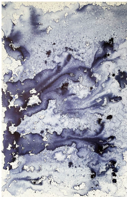
©Joëlle Cabanne, Aletsch , 2024, Encre indigo et eau de glacier sur toile, 120 X 80 cm.