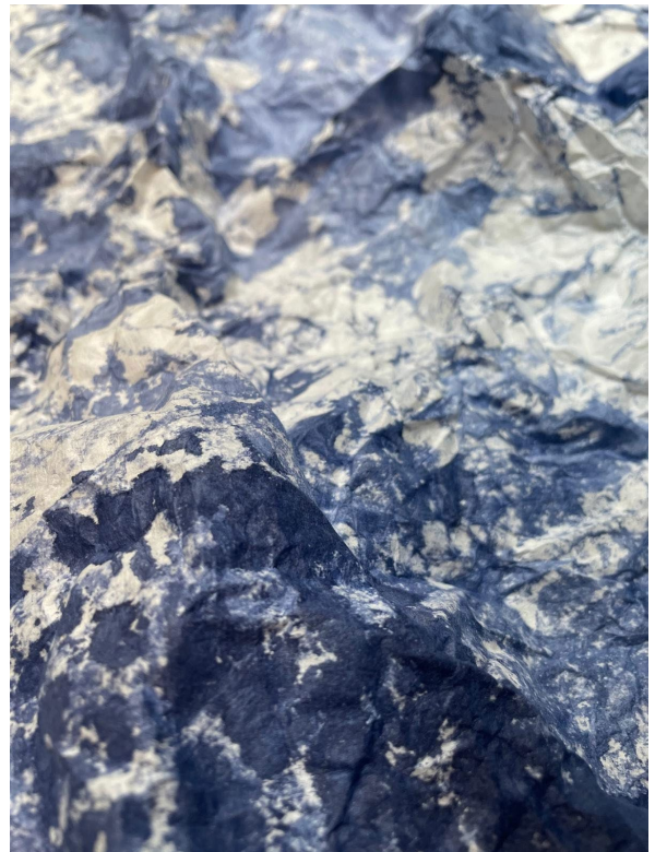
© Joëlle Cabanne, Genius Loci , 2025, encre indigo sur papier Hawagami, extrait oeuvres en papier 250 x 90 cm.