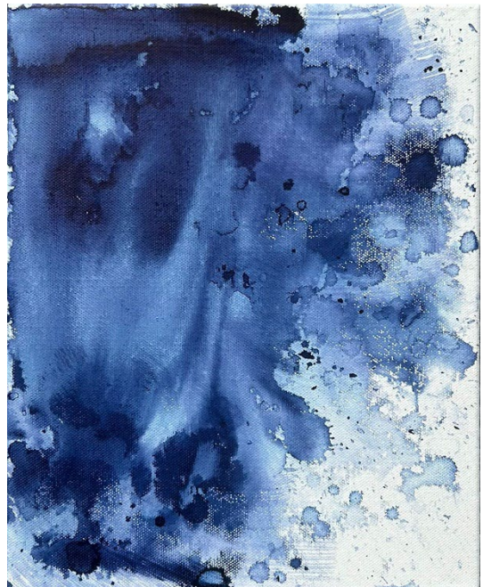
© Joëlle Cabanne, Genius loci , 2025, Encre indigo sur toile, 24 x 30 cm.