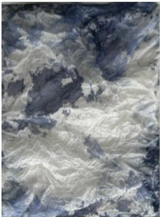
© Joëlle Cabanne, Genius Loci *3 volume , 2025, encre indigo sur papier Hawagami 30g, 54 x 42 cm.