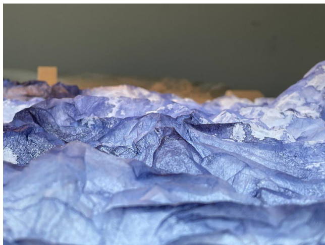
© Joëlle Cabanne, photographie prise de vue en atelier, 2024