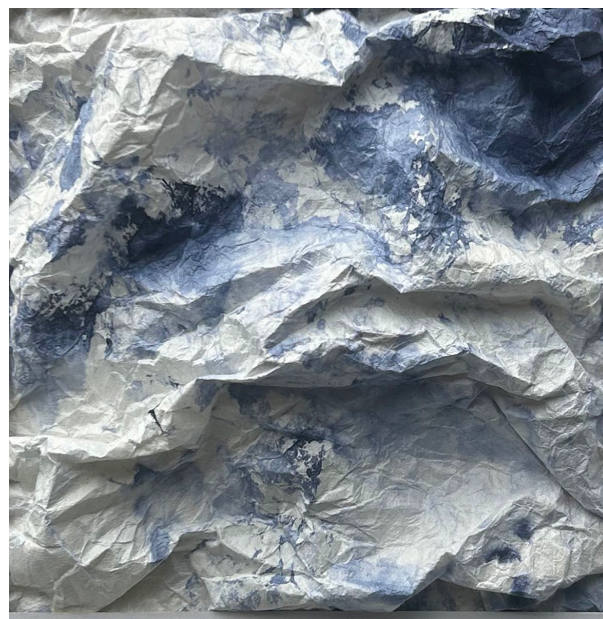
© Joëlle Cabanne, Genius Loci *4 volume , 2025, encre indigo sur papier Hawagami 70g, 33x33 cm.